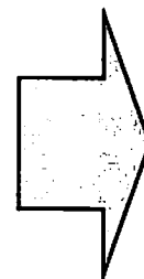
〔平成23年度以降〕 〔新課程〕