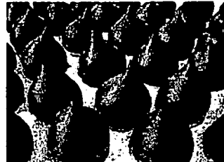
CHOCOLATE ⇒Child Labor, Human Trafficking