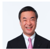
ごあいさつ 神奈川県知事 松沢 成文

「かながわ犯罪被害者サポートステーション」は、本年6月1日に開設1周年を迎えます。